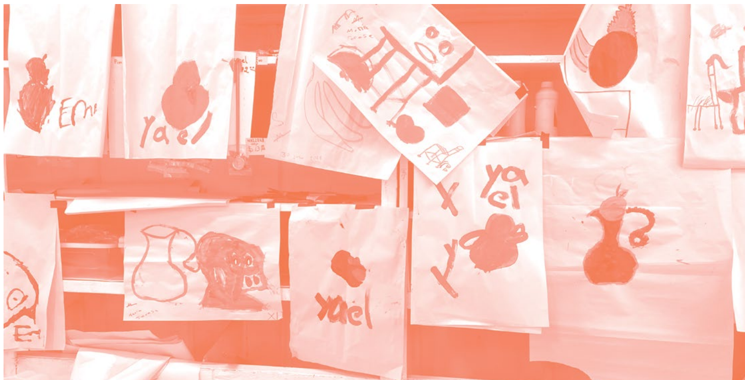
Cortesía del artista