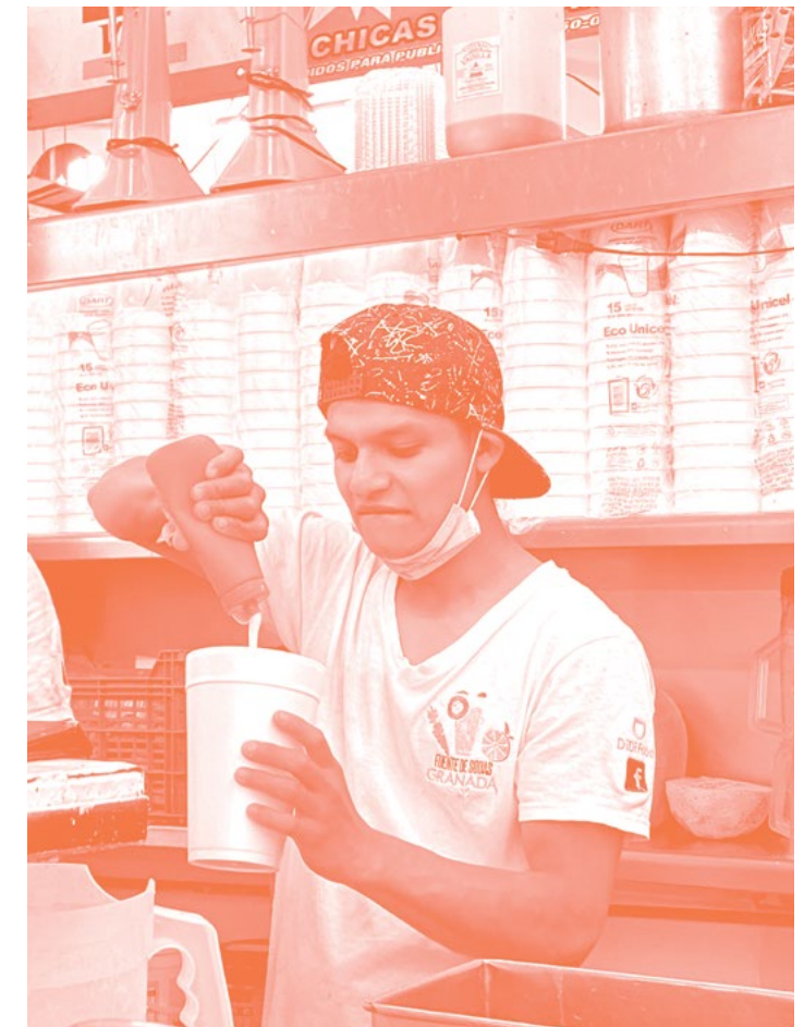
Fuente de sodas, 2022.

De la estridencia producida por diversidad de fuentes musicales simultáneas en la zona de cocinas y efusivas conversaciones de comensales, a la sigilosa riqueza acústica del área de oficios, el Mercado Granada tiene un amplísimo menú de sonoridades: desde los cantos que ofertan los productos y los servicios, hasta las obras aurales de las máquinas y las herramientas de trabajo que proyectan la enérgica vida de esta comunidad. Estos sonidos son testigos de labores que resisten a pesar de las adversidades económicas, políticas y sociales de nuestro tiempo. Son también una oda a la familia y la amistad.