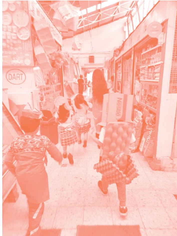
Búsqueda del tesoro, 2022. Cortesía de la artista

Tomarse el tiempo de parar, escuchar, sentir y habitar los espacios de intersección de dinámicas diversas. Permitirse de-construir relaciones cotidianas pre-condicionadas y así propiciar nuevas constelaciones. Dedicar tiempo, afecto, mirada y presencia puede llegar a incomodar las metodologías propias de la producción creativa; requiere de un compromiso para re-pensar el largo de los brazos, la coordinación de tantas piernas caminando juntas, dejar ir la forma para fluir con las negociaciones complejas de la multiplicidad y así poder dimensionar la nueva sombra colectiva que, en movimiento, empezamos a generar.