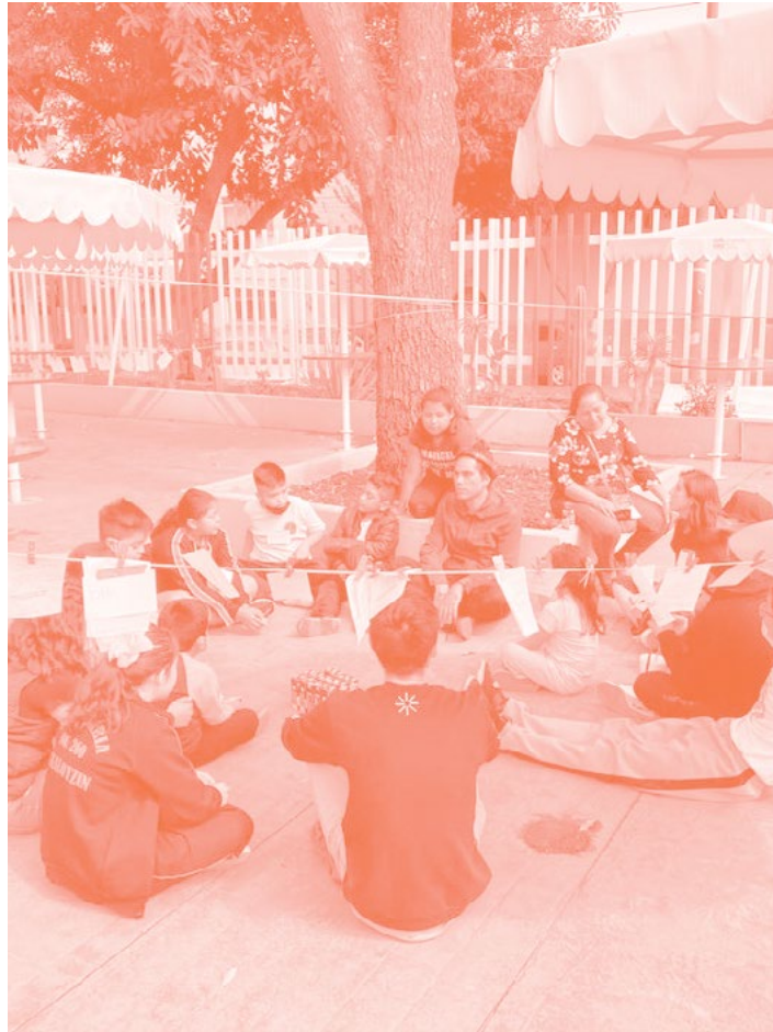
Mi mercado de Granada, 2022.