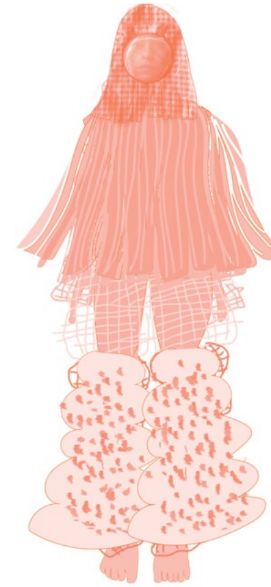
Boceto de Granada, 2022. Cortesía de la artista

Un proyecto comunitario entre una institución cultural y una comunidad empieza por crear vínculos afectivos. Para que esto suceda se requiere de tiempo y razones para convivirse, convivirse para entenderse y entenderse para asociarse. En poco tiempo, mediante Museos en común en el Mercado Granada vimos nacer estos vínculos con los que logramos nuestro primer objetivo en común, crear un espacio en el mercado para jugar, compartir e imaginar nuevas ideas. Este logro lo celebramos con una fiesta (tiempo y razón para convivirnos) en las calles de la colonia. ¡Ahí nos vemos!